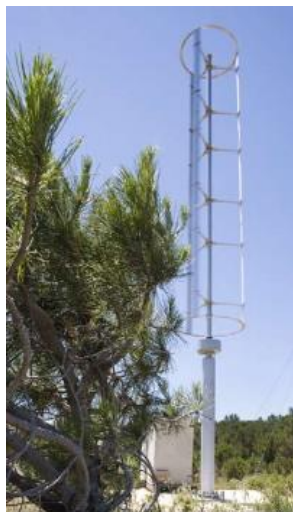
Eoliennes axe vertical de type Darrieus