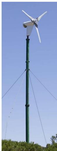
Axe horizontal à hélices

Fiche réalisée par l'AGEDEN AG / NR Mise à jour août 2016