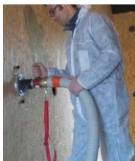
Insufflation isolante en vrac